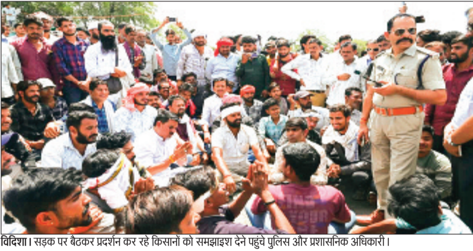
विदिशा। सड़क पर बैठकर प्रदर्शन कर रहे किसानों को समझाइश देने पहुंचे पुलिस और प्रशासनिक अधिकारी।

कृषि उपज मंडी में गेहूं की नीलामी अचानक बंद होने से नाराज किसानों ने सोमवार को हंगामा किया। आक्रोशित किसानों ने मंडी के बाहर प्रदर्शन करते हुए चक्काजाम कर दिया और व्यापारियों के खिलाफ नारेबाजी की। इस दौरान सड़क पर यातायात बाधित रहा, जिससे आम लोगों को परेशानी हुई। किसानों का आरोप था कि उन्हें अपनी उपज का उचित मूल्य नहीं मिल रहा है। उनका कहना है कि शनिवार को जो गेहूं 3 हजार रुपए प्रति क्विंटल बिक रहा था, वह सोमवार को 2100 रुपए