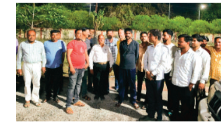
सभी के खिलाफ मामला दर्ज किया गया। रात करीब 9:30 बजे घटना की जानकारी मिलते