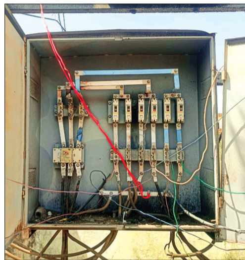
इशार। ट्रांसफार्मर से अवैध तरीके से इस तरह कनेक्शन दिए जासके चलते लोड बढ़ने से बार-बार लाईट खराब हो रही है।

सप्लाई के लिए विद्युत वितरण कंपनी द्वारा गांव को चार सेक्शन में बांटकर 4 ट्रांसफार्मर लगाए गये हैं। आदिवासी और मुस्लिम मोहल्ले को बिजली वितरण करने वाले दो ट्रांसफार्मर पिछले कई महीनों से खराब पड़े हैं। लेकिन इनको ठीक कराने के बजाय कंपनी के कुछ नुमाइंदों ने उक्त मोहल्ले के उपभोक्ताओं को अवैध रूप से पंचायत भवन के समीप स्थित ट्रांसफार्मर से कनेक्शन जोड़ दिए हैं। इसके चलते संबंधित क्षेत्र के