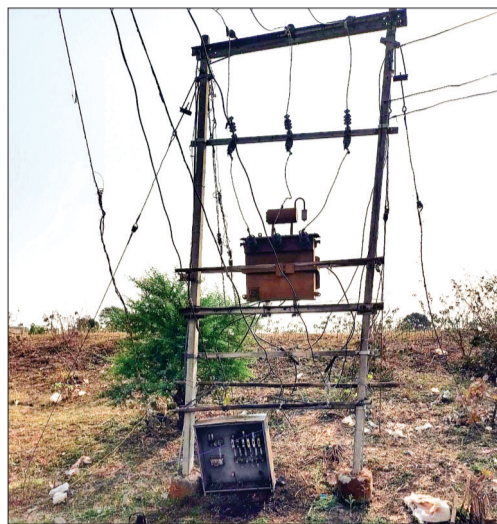
इशार। गांव दौलतपुर में मुस्लिम, एवं आदिवासी मोहल्ले को बिजली सप्लाई करने वाला ट्रांसफार्मर महीनों से खराब पड़ा है।

करीब 18 सौ से अधिक आबादी वाले दौलतपुर में बिजली